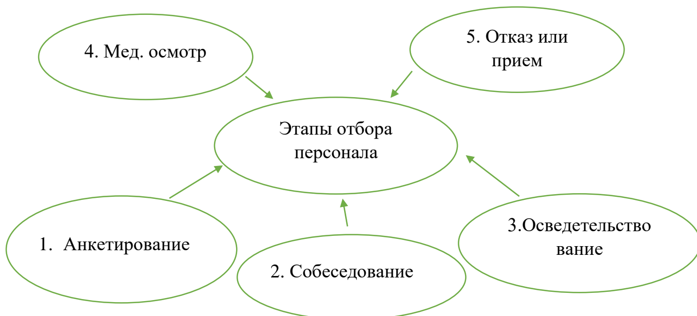
Рисунок 1 – Этапы отбора персонала

Вышеперечисленные факторы помогут расширить поиск кандидатов в выборе сотрудника на работу[3].