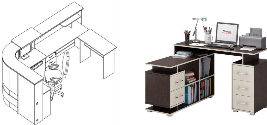
Рисунок 2. Примеры П-образного места секретаря

Организация рабочего места в первую очередь - это система мероприятий по оснащению рабочего места средствами и предметами труда и их многофункциональному размещению. Рассмотрим, сначала, мебель — стол и стул. Беря во внимание насыщенность трудового процесса секретаря оргтехникой, оправданной будет П-образная планировка рабочего места (рис. 2).